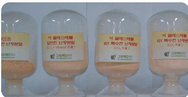
Low Cholesterol Immuno globulin Yolk(Igy) Powder