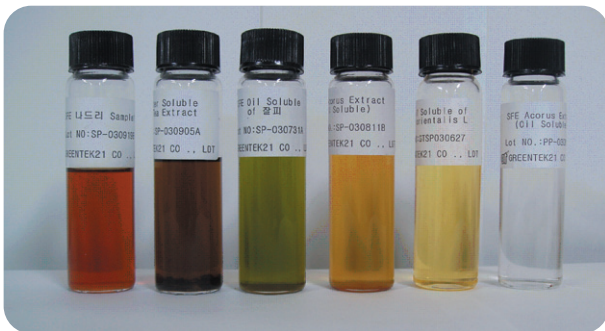
Color Ingredients For Cosmetic Products

조구 등 추출 포스포리파제 저해 항암활성 화합물 삼백초로부터 추출한 HNP-9870A 등의 항암제 제법 및 조성물 초임계유체를 이용한 1,3 베타글루칸 고순도화 특수면역항체의 역가가 향산된 난황분말 및 그의 제조방법 등 다수