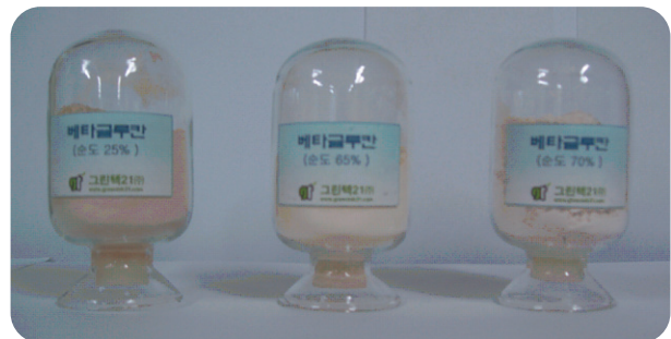
High Quality b-1,3-Glucan from Baker's Yeast

본사 및 연구소 : 경기도 성남시 중원구 상대원동 66-2 생명공학커뮤니티 Bio21 3층 전화 : 031-743-8916 팩스 : 031-743-8913 홈페이지 : www.greentek21.com