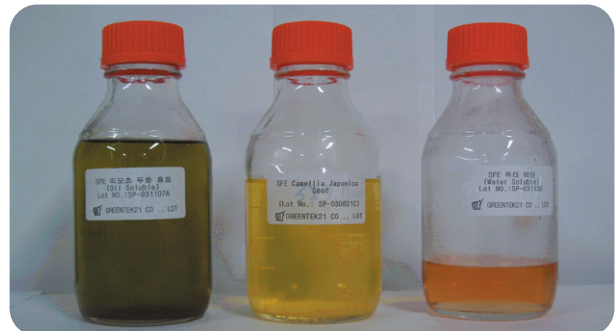
Functional Ingredients For Cosmetic Products